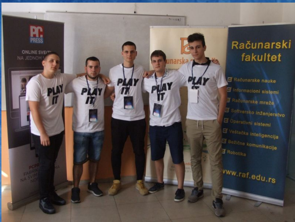
I mesto Tim LolKon ETŠ Rade Končar